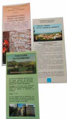
Chacun dépliant invite à des déambulations à pied ou en voiture pour des visites sur place, à la carte.