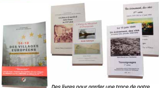
Des livres pour garder une trace de notre histoire locale et pour servir de témoignages pour le futur.