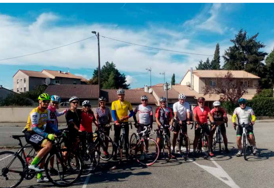
Le club cyclo propose trois sorties hebdomadaires en groupe aux amateurs de vélo désireux de rejoindre les rangs du CCD.