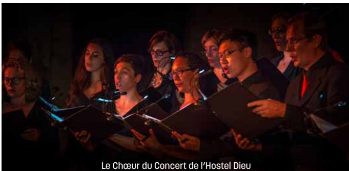
Le Chœur du Concert de l'Hostel Dieu