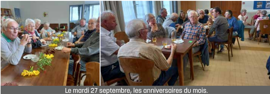
Le mardi 27 septembre, les anniversaires du mois.